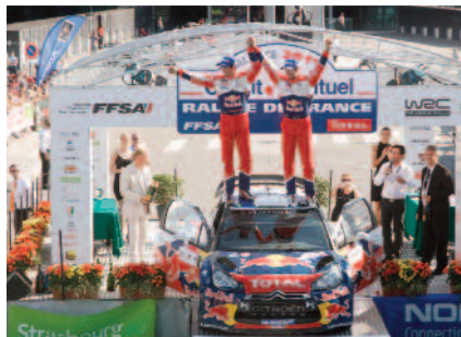
Vainqueurs 2011 : Sébastien Ogier et Julien Ingrassia.