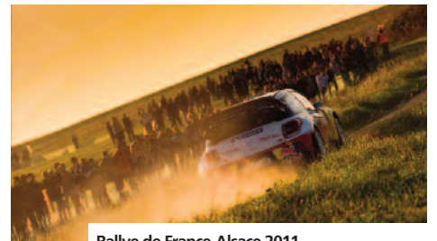
Rallye de France-Alsace 2011.

La stratégie marketing et de communication sera également enrichie, pour développer de nouvelles actions sur le long terme.