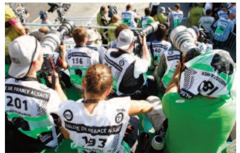
La tribune photographes.