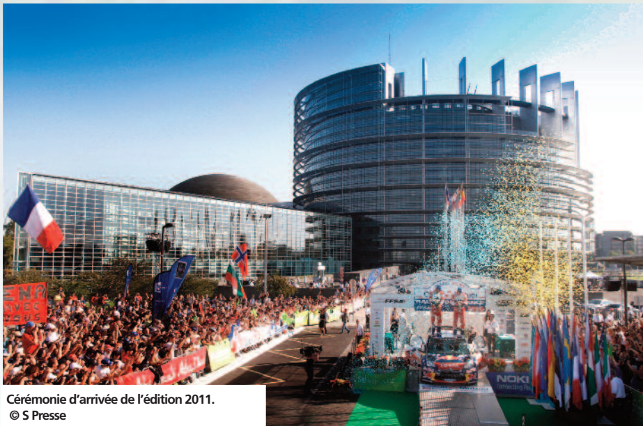
Cérémonie d'arrivée de l'édition 2011.

« 2012 marque le 60 ème anniversaire de la FFSA, 60 ans au service de la passion du sport automobile. Il est essentiel pour la FFSA de faire perdurer un événement phare tel que le Rallye de France et de relever de nouveaux défis pour faire progresser cet événement, organisé dans un cadre magnifique offert par la région Alsace ».