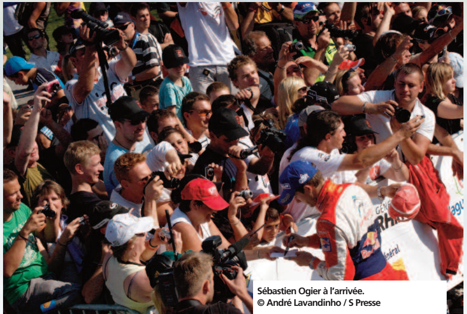
Sébastien Ogier à l'arrivée.

** Source : North One Sport et Kantarsport (News n°216-octobre 2010)