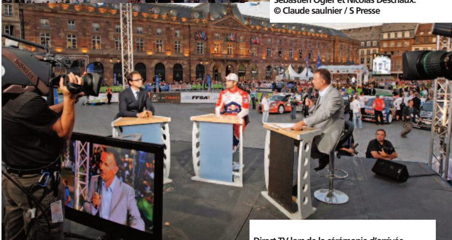
Direct TV lors de la cérémonie d'arrivée.