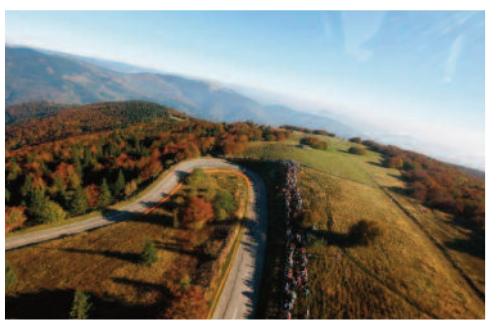
Vues aériennes du parcours 2011.